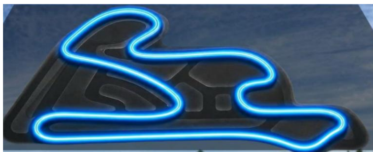
EXTENSÃO: 890M - SENTIDO: HORÁRIO